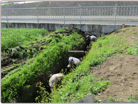
《シャベルで泥上げ中!!》